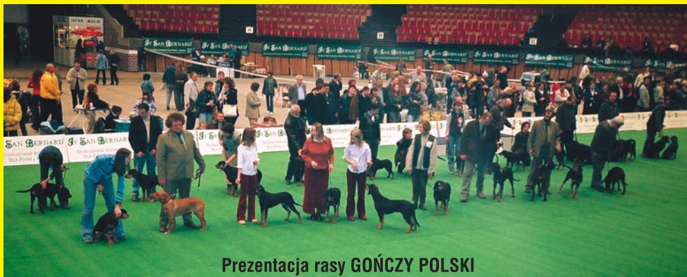
Prezentacja rasy GÓNCZY POLSKI